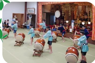
【寺子屋プロジェクト：うりっ子太鼓】