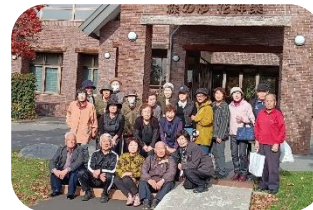
【わくわくバスツアー-in 東神楽】