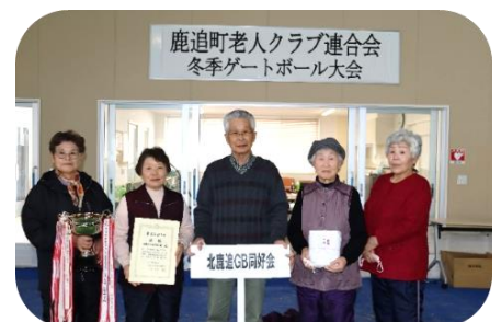
優勝チーム：北鹿追 GB 同好会

第32回鹿追町老人クラブ連合会冬季ゲートボール大会を、交流センターみないるにおいて開催し、6つの単位クラブから7チーム42名が参加しました。各チームがそれぞれ持てる力を発揮し、ナイスチームワーク・ナイスプレーの熱戦を繰り広げ、令和6年度最後の事業を盛り上げました。