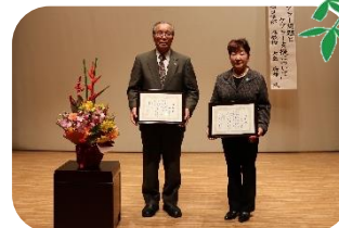
【鹿追町社会福祉大会】