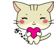
(←写真) 第一生命労働組合帯広支部様