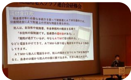
特殊詐欺被害に遭わない!!

今回の研修会は研修会場に講師をお迎えして開催する予定でしたが、前日の記録的な大雪のため講師の移動が困難となり、急遽、鹿追町老連として初の試みであるオンラインセミナーに一部変更して実施しました。